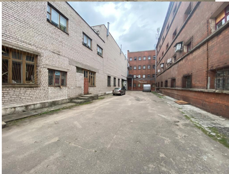
Существующая территория двора бывшей фабрики